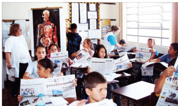
Foto. Episódio ocorrido em escola de PG é discutido em sala de aula, estimulando que crianças reflitam sobre seus atos