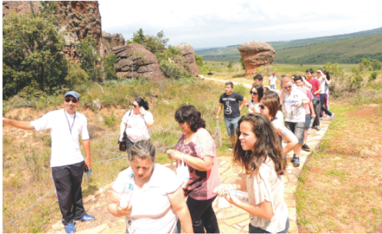
O grupo realizou um passeio turístico e conheceu o Museu da Época e Parque Nacional Vila Velha

SUZANI ROVARIS suzani@correiolageano.com.br