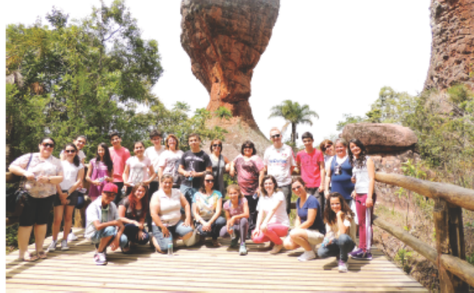
Alunos vencedores da Maratona do Conhecimento, do Lendo e Relendo, têm programação intensa em viagem ao Paraná