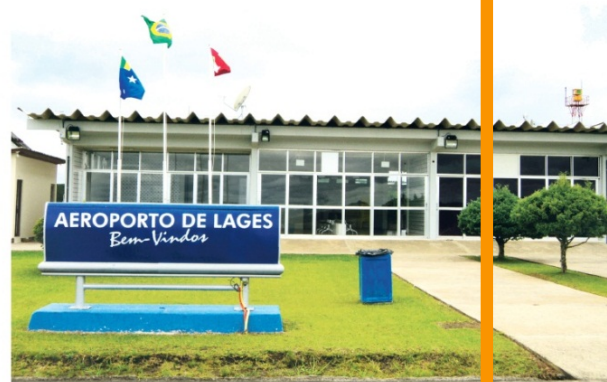
A Agência Nacional de Aviação Civil precisa autorizar pedido da Brava Linhas Aéreas para que voos comecem

Anac terá de avaliar documentação que pede a mudança de rota