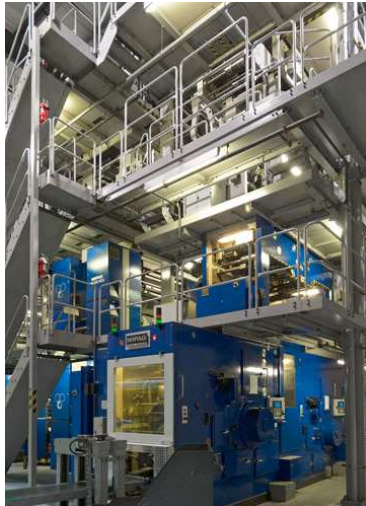
Die Wifag OF370 bei "The Chronicle Herald"

Zusätzliche Fotos (hi-res Versionen in separaten Dateien)